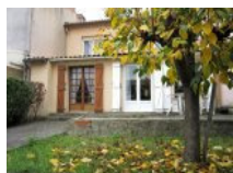
Vente Maisons / Villas 103m 2 à CARCASSONNE (11)