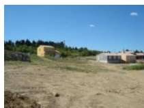
Vente Terrains 208m 2 à CARCASSONNE (11)