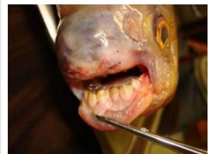
Un poisson à dents et "mangeur de testicules" arrive dans nos rivières