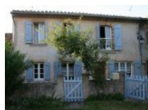
Vente Maisons / Villas 167m 2 à CARCASSONNE (11)